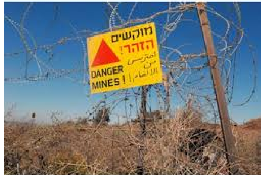
גדר תלתלית מקיפה שדה מוקשים

צפייה בסרטון חפץ חשוד – הרשות לפינוי מוקשים: