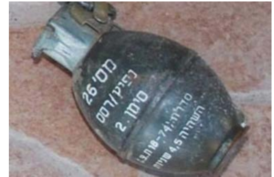
רימון שנזרק ללא נצרה