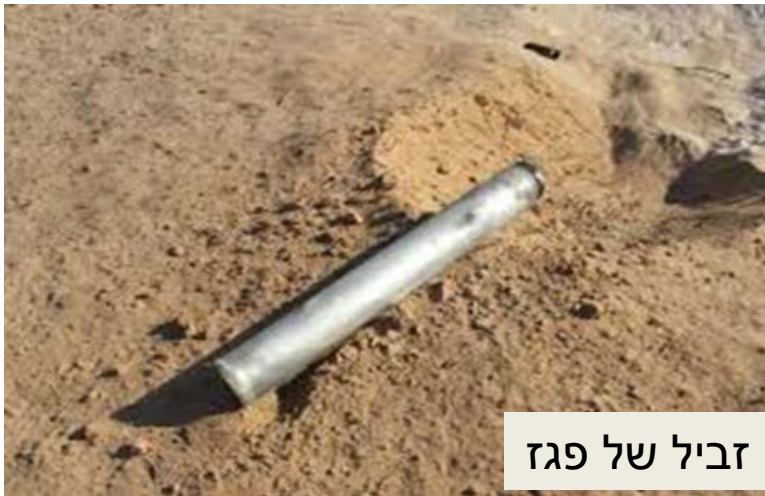
זביל של פגז