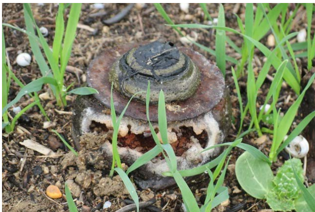
מוקש נגד בני אדם נסתר בין השיחים