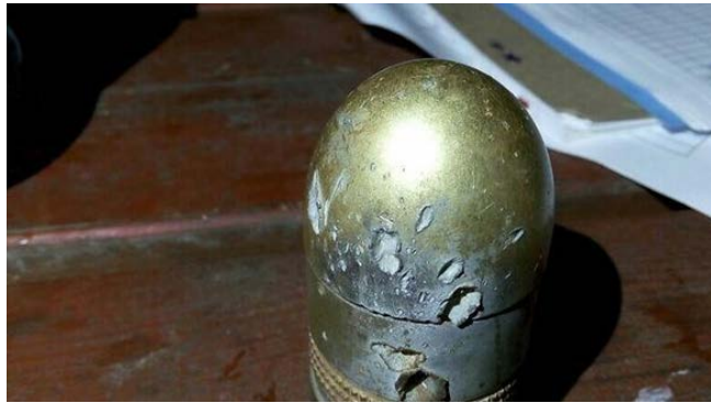
רימון שנורה ולא התפוצץ