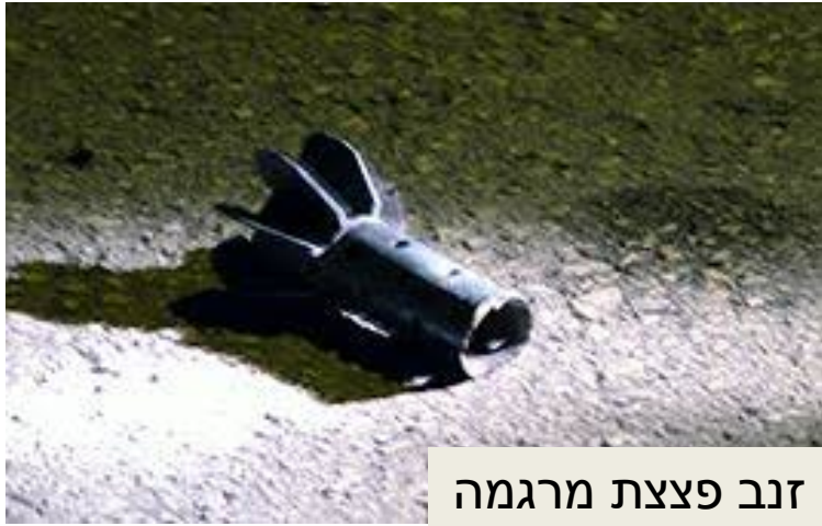
זנב פצצת מרגמה