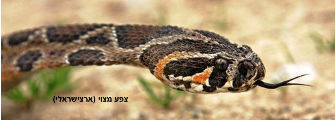
צפע מצוי (ארצישראלי)