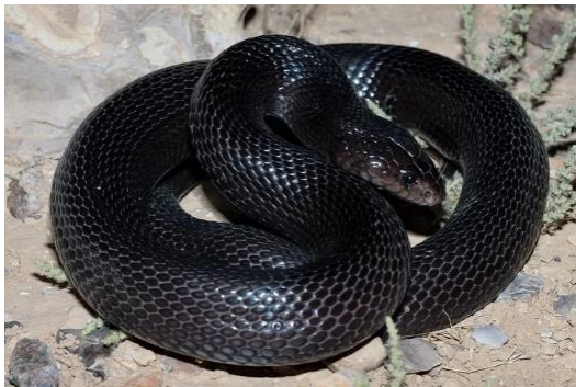
שרף עין גדי

בערבה, ים המלח - כיכר סדום וצפונה לבקעת הירדן ועד לגלבווע, במדבר יהודה - ממעלה אדומים ומזרחה וכן בלב הנגב.