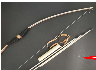
חץ וקשת מותר לשימוש