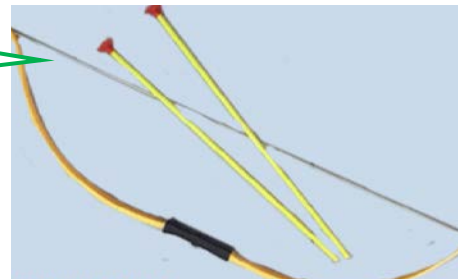
חץ וקשת אסור לשימוש